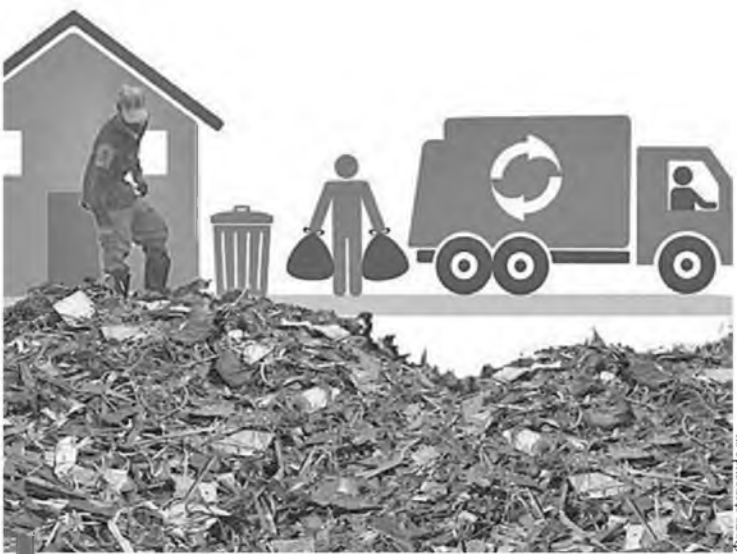
Договор с региональным оператором должен заключить каждый собственник

Договор с региональным оператором должен заключить каждый собственник отходов, то есть каждый из нас. Если учесть, что в настоящее время в Российской Федерации за вывоз мусора платят чуть более 57% жителей, то для многих реформа может показаться болезненной. Но порядок в этой сфере наводить необходимо. И это не самый жесткий вариант из возможных.